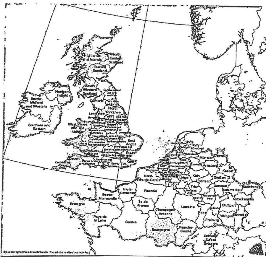
Structural Funds 2007-2013: Transnational Cooperation areas North West Europe